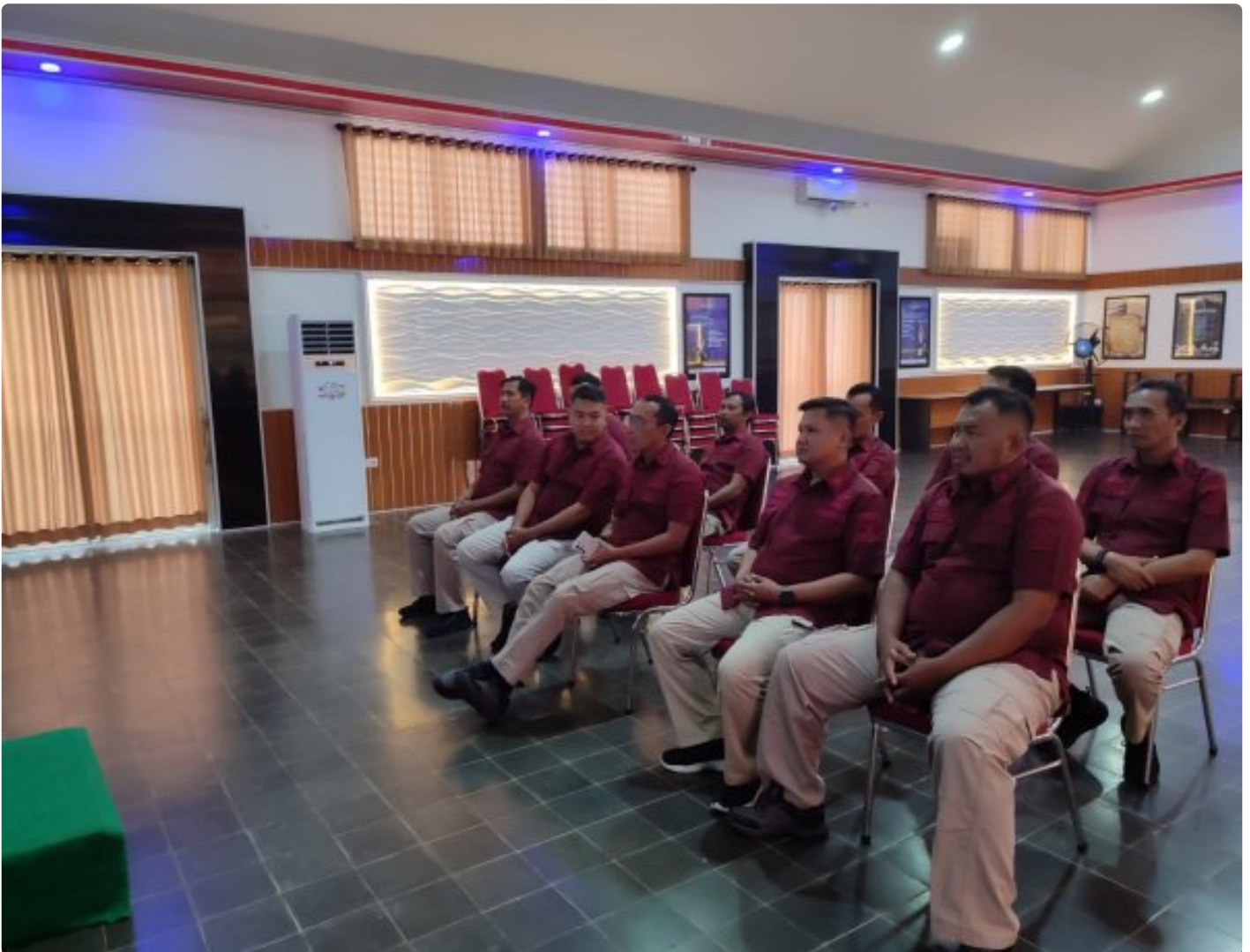
Bangun Personal Branding ASN, Lapas Besi Hadiri Webinar Series 6

CILACAP – Petugas Lapas Kelas IIA Besi Nusakambangan menghadiri kegiatan Webinar Series 6 yang diselenggarakan oleh Badan Pengembangan Sumber Daya Hukum (BPSDM) dan HAM bertempat di Aula Wijaya Kusuma, Kamis (24/10/2024).